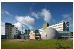
Vysoké učení technické v Brně