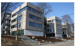
Veterinární a farmaceutická univerzita Brno