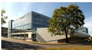
Mendelova univerzita v Brně